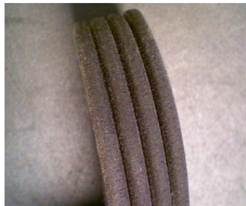
Ejemplo de una correa acanalada modificada

A pesar de las diferencias ópticas, la nueva versión no presenta desventajas en cuanto a rendimiento.