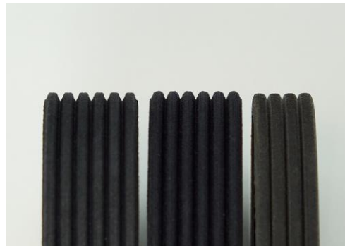
Los tipos de perfil modificados son difíciles de percibir a simple vista.